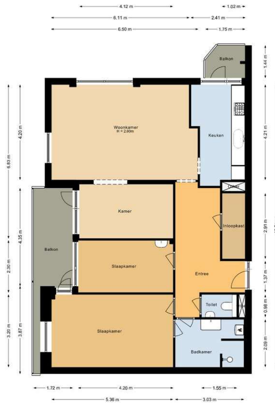
Appartement Robert Kochlaan 360 Haarlem